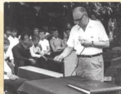
Лекцию читает академик Мартин Израильевич Кабачник