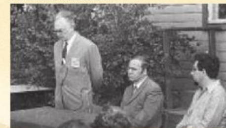
Академик Борис Александрович Арбузов рассказывает юным химикам о Казанской школе химиков