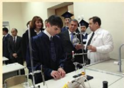
Посещение Президентом РТ лицея-интерната. Проведение лекций преподавателями «КНИТУ» для учащихся лицея.

- выявление и отбор интеллектуально одаренных и мотивированных учащихся, проявляющих выдающиеся способности в изучении математики, химии, физики и биологии из